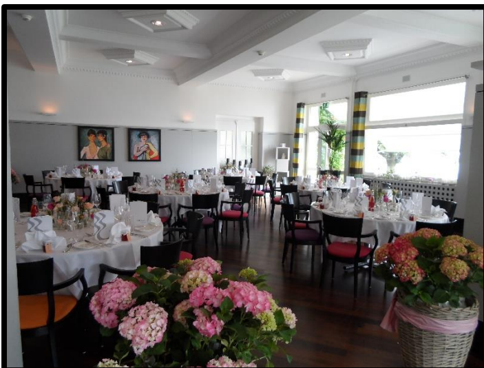
La grande Salle