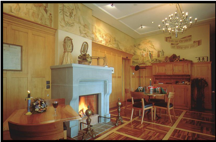
Das Rigi Stübli